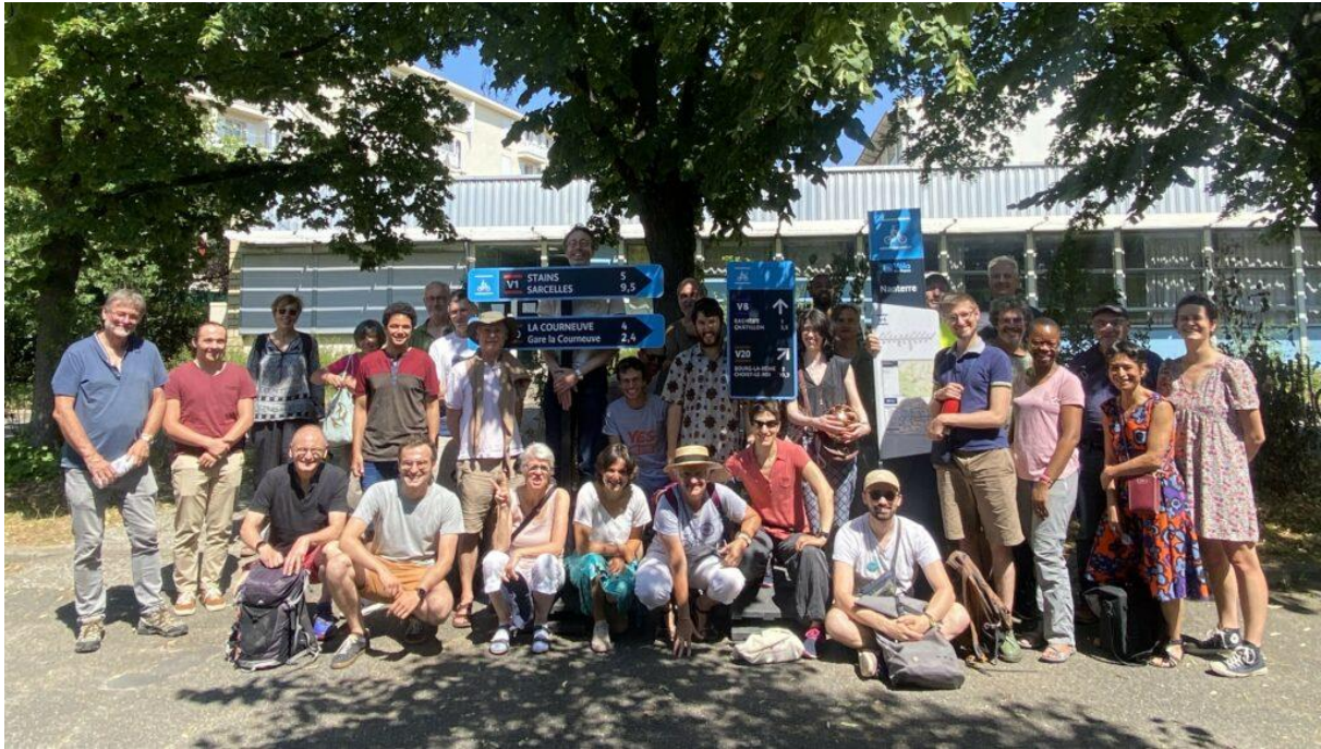
Le Collectif lors de la Journée du Collectif de juin

La participation au « Journées du Collectif » en juin et décembre 2023, ces journées sont accessibles à l'ensemble des adhérents des associations membres du Collectif,