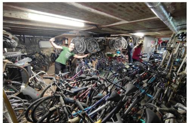
Dans le cadre de la 9e Semaine européenne de la réduction des déchets, les bénévoles d'Un Vélo qui roule vont récupérer les vélos usagés afin de les remettre en état pour les mettre à disposition d'écoles ou de personnes en difficulté. © Un Vélo qui roule

Des collectes de vélos usagés sont proposées à Conflans, Andrézy, Maurecourt et Chanteloup-les-Vignes, du 18 au 26 novembre pour la Semaine européenne de la réduction des déchets.