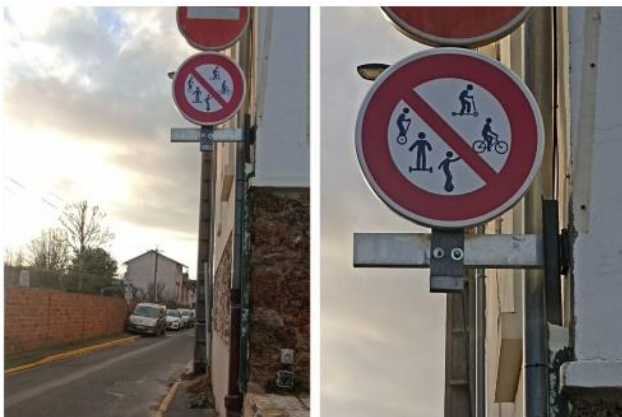
Les nouveaux panneaux interdisant la circulation à contresens des vélos, trottinettes et autres « engins de déplacement personnels motorisés » a fait réagir les internautes de Maurecourt.

L'interdiction pour les vélos, trottinettes et "engins de déplacement personnels motorisés" d'emprunter à contresens l'ensemble des rues à sens unique fait débat.